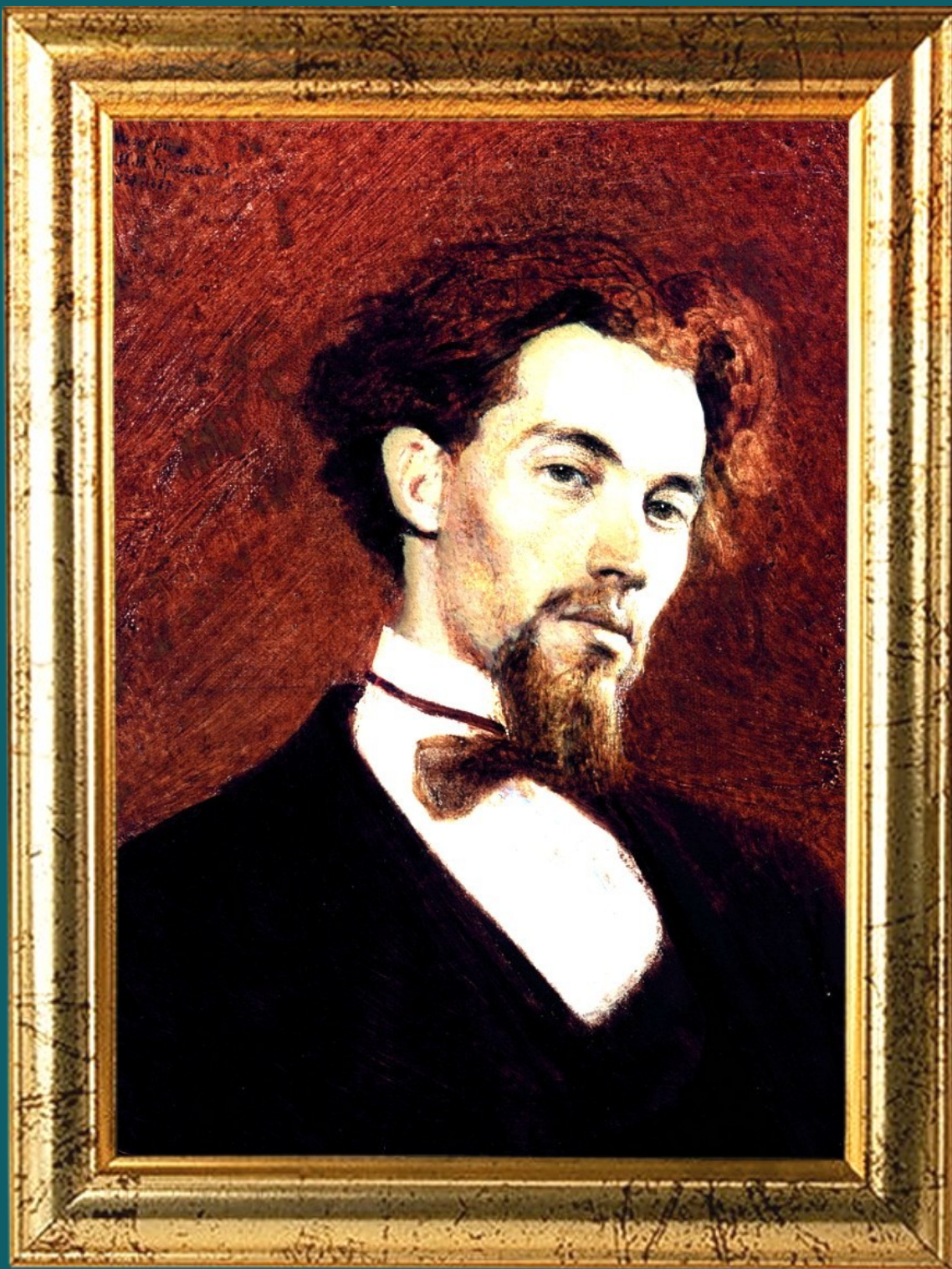
Иван Николаевич Крамской Портрет художника Константина Савицкого 1871