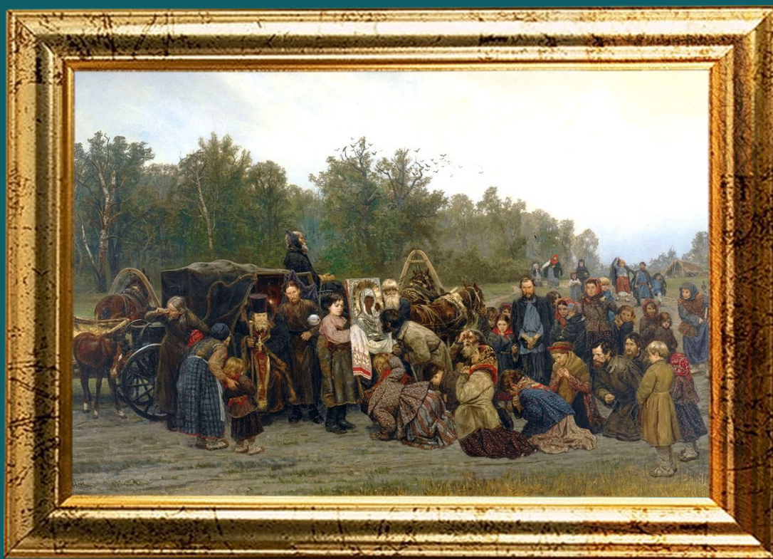
Константин Аполлонович Савицкий "Встреча иконы" 1878

ном Крамским в Тульской губернии. Они жили недалеко от станции Козлова Засека, где Савицкий наблюдал за работой по прокладке железнодорожных путей. Он целыми днями находился у железной дороги и писал этюды для будущей картины. Картина «Ремонтные работы на железной дороге» была представлена в 1874 году на 3-й выставке Товарищества передвижных художественных выставок («передвижников») и произвела там хорошее впечатление. Её приобрёл для своей галереи Павел Третьяков. На полученные от продажи картины деньги Савицкий смог организовать свою поездку во Францию. В 1878 году картина была представлена на Всемирной выставке в Париже и была положительно встречена критиками.